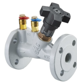
DN 20 - 80