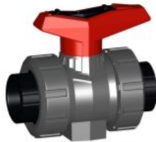
DN10/15 - 50